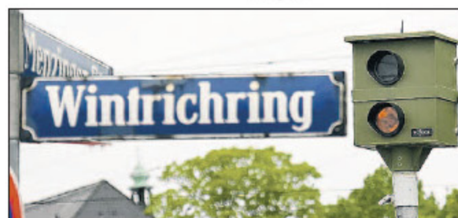
Fieser Doppelblitzer an der Menzinger Straße/Wintrichring: Geschwindigkeitsmessung in der Blitzampel