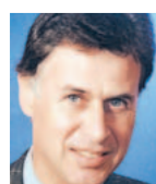
Peter Brandstaeter Fonds-Laden München