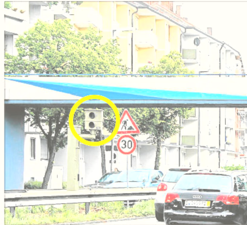
Stadtauswärts steht der Giesinger Blitzer an der Fußgängerüberführung