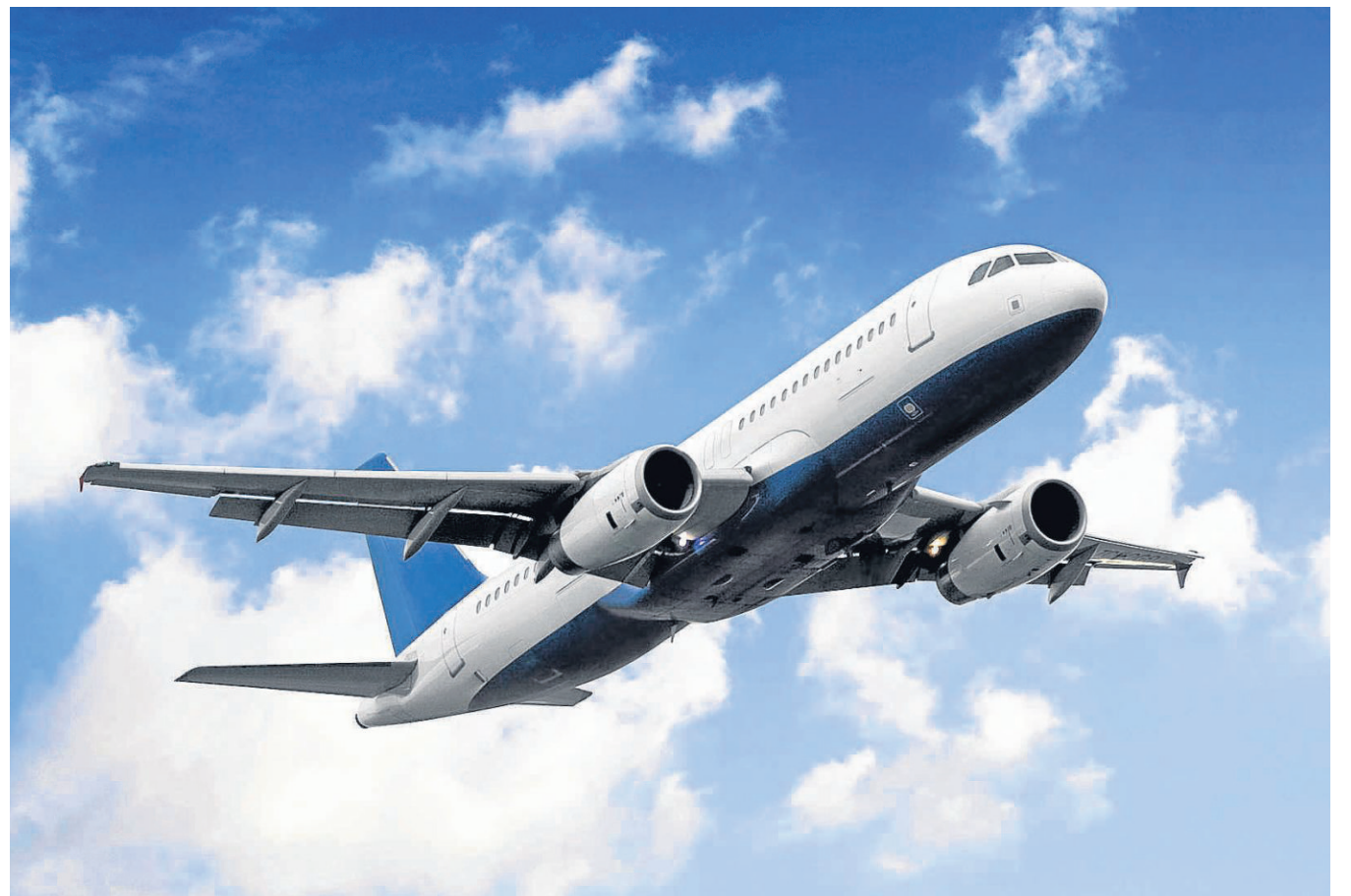
Fliegen ist nicht gleich fliegen: Der Flugatlas 2011 vergleicht sowohl Preis als auch Leistung der Airlines.

Ferienzeit ist Reisezeit. Doch eine der entscheidenden Fragen, die vor dem Urlaub meist geklärt werden muss, ist: Mit welcher Fluggesellschaft fliegt man. Hier soll der Flugatlas 2011 vom Verein „Mobil in Deutschland“ helfen. Darin werden die wichtigsten Fluglinien anhand eines Kriterienkatalogs verglichen. Zwar liegt der Schwerpunkt auf dem Preis – schließlich will man die Urlaubskasse ja nicht schon beim Flug unnötig belasten. Doch auch Komfort und Service gehen in die Bewertung ein.